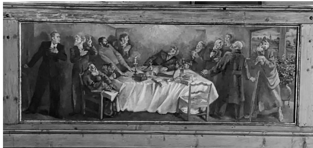
Emporenmalerei der Tautenhainer Kirche